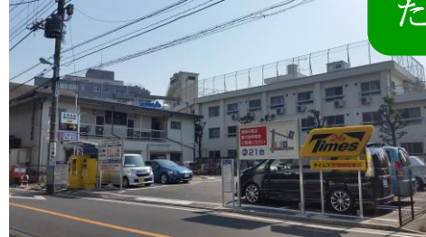
リニューアルした第2駐車場

これまで当院の第2・第3駐車場は無料でしたが、違法駐車が多く、外来患者様の車が停めにくい状態でした。こうした慢性的な駐車場不足解消のため、駐車場のご利用方法を変更させていただきますので、お知らせいたします。