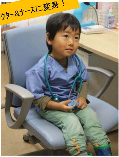
ドクター&ナースに変身!