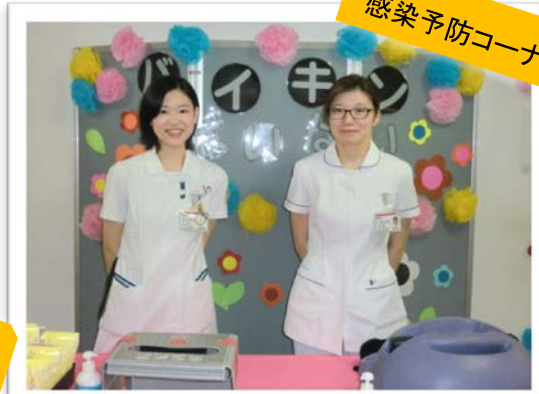
感染予防コーナー