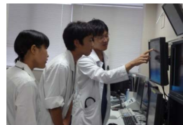
血管造影室での医師の説明を聞き入 る井荻中学校の生徒さん達

6月から9月にかけて、荻窪 中学校、和田中学校、井荻中学 校の生徒さんが職場体験にきて くれました。彼らのフレッシュ